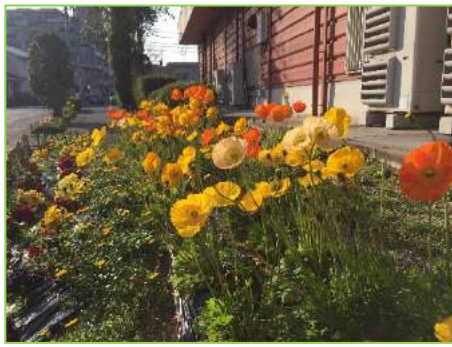
いまが見ごろですよ～♪